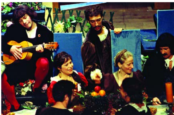
Cena de conjunto, Comedia Ulysippo

Também algumas das personagens surgiam do alçapão do teatro, o sub-palco do Trindade, e todo o conjunto pretendia dar a ideia da própria cidade, construída em diferentes planos. O azul projectado no ciclorama ao fundo dava profundidade ao espaço cénico, e evocava a singular luminosidade do céu de Lisboa.