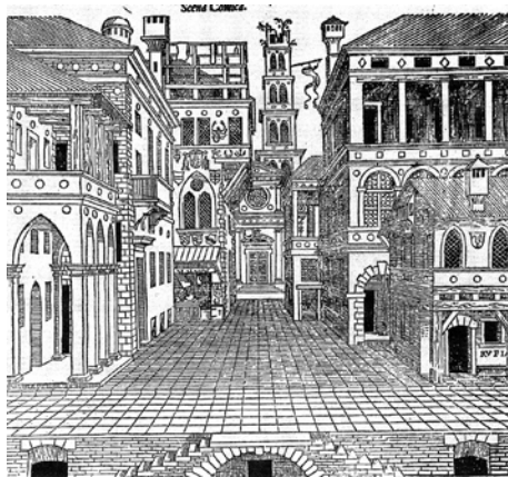
Serlio, Scena comica , 1545

No entanto, ficavam problemas por resolver. Por exemplo, como criar os interiores das casas dos dois jovens cortesãos? Curiosamente os mesmos problemas que a scena comica renascentista não resolveu. O resultado final permitiu mostrar ao público, todo um conjunto de propostas cénicas adequadas ao desenvolvimento da fábula. A ilusão teatral fez o resto.