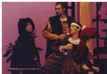
Cenas de conjunto, Comedia Ulysippo

Também algumas das personagens surgiam do alçapão do teatro, o sub-palco do Trindade, e todo o conjunto pretendia dar a ideia da própria cidade, construída em diferentes planos. O azul projectado no ciclorama ao fundo dava profundidade ao espaço cénico, e evocava a singular luminosidade do céu de Lisboa.