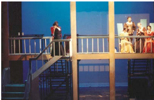
Perspectiva do espaço cénico da Comédia Ulysippo

À direita do público situava-se a casa do cidadão Ulysippo, com um patamar praticamente ao nível do chão do palco, e um outro piso superior onde decorriam as cenas de interior com a mulher e as duas filhas. À esquerda, ainda nesse piso, ficava a casa de Florença/Macarena, à qual se podia igualmente aceder através de uma escadaria exterior. Ao meio desta estrutura vertical, ao nível do chão, convencionou-se ser a casa dos dois mancebos, pretendentes das filhas de Ulysippo.