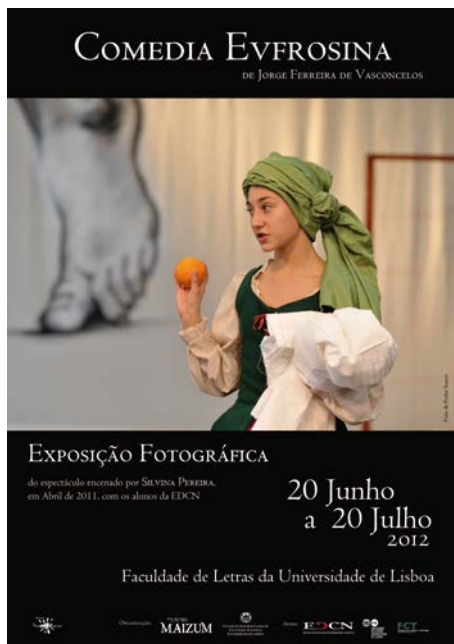
Cartaz Exposição Comedia Eufrosina na FLUL

Estas iniciativas constituíram matéria de reflexão sobre a presença dos clássicos na escola, assente numa prática concreta e não em juízos de valor a priori , tendo sido publicado o estudo Eufrosina regressa à escola na Revista Euphrosyne do Centro de Estudos Clássicos em 2012.