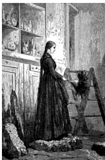
Fig. 5 - Graüben

com um aspecto ligeiramente sensual (A-79) e ainda mais velha e sofisticada na adaptação de A-80.