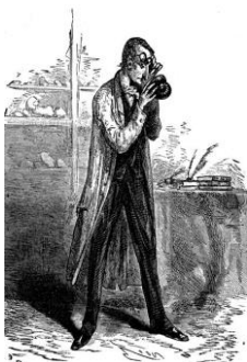
Fig. 2 - Lidenbrock