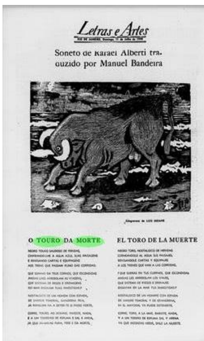
Fig. 1: Página do suplemento “Letras e Artes” de 11 de julho de 1948.

Em 11 de julho de 1948, o suplemento cultural “Letras e Artes” do jornal brasileiro A manhã reuniu na última página da edição os nomes de dois poetas sob o título: “Soneto de Rafael Alberti traduzido por Manuel Bandeira”. Acima dos versos em português ladeados pelo original em espanhol, reproduzia-se uma xilogravura do artista galego-argentino Luis Seoane: